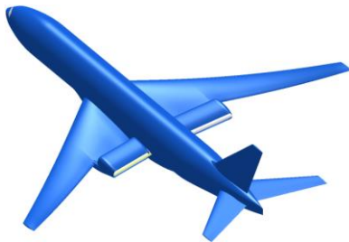
Figure 1 : Concept multifan multifan

L'ISAE-Supaero, acteur reconnu dans la recherche aéronautique, est très actif à différents niveaux concernant les questions de protection de l'environnement. Ce cadre donne de véritables challenges pour penser l'aéronautique de demain et développer les supports/outils académiques associés. Le projet proposé viendra renforcer l'équipe (enseignant-chercheur, doctorants, post doctorants) qui s'inscrit dans cette perspective. Plus concrètement la ou le chercheuse( r)-stagiaire aura pour mission de caractériser les performances d'un système propulsif novateur appelé « multifan » (figure1) . Ce dernier se présente sous la forme d'un générateur de gaz qui fournit la puissance à plusieurs groupes fan, chacun entraînés par une turbine (figure 2).