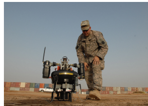
FIGURE 1.2 – Exemple d'image au format JPG.